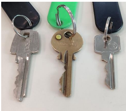
3 Llaves tipo Yale