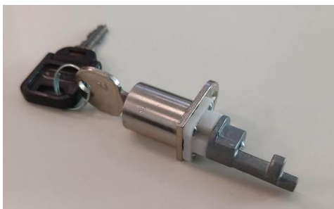
5 Cerradura de escritorio