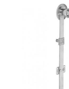
6 Cerradura central de cajonera