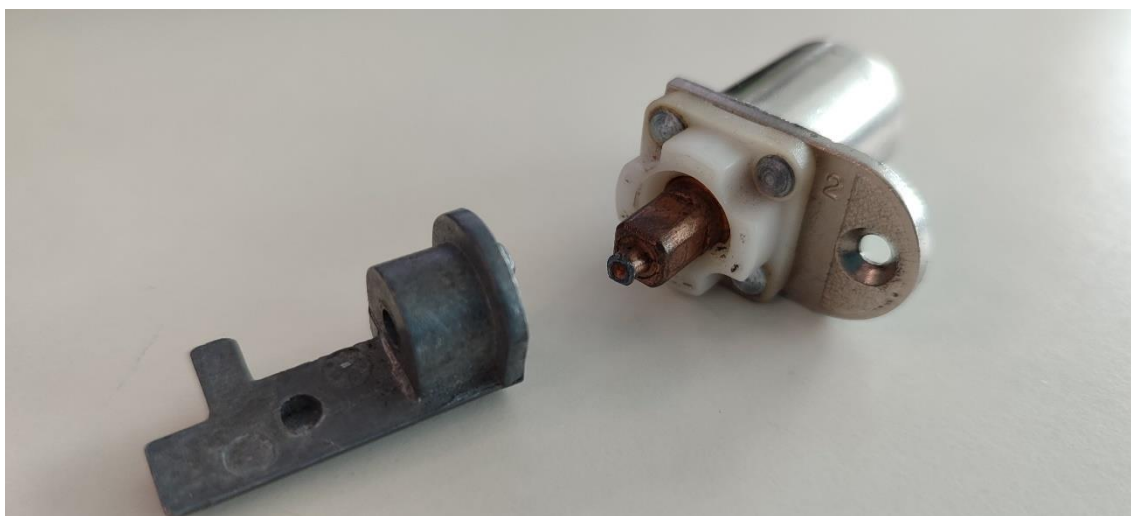
9 Cerradura de escritorio a reensamblar

Reparación de cerradura de escritorio: incluirá todos los trabajos para el correcto funcionamiento de una cerradura de escritorio. Antel entregará todas las partes para su reensamble.