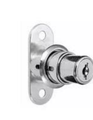
8 Cerradura de inyección