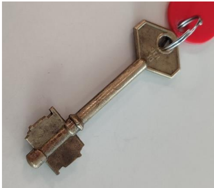
1 Llave tipo Star