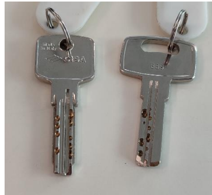
2 Llaves de punto