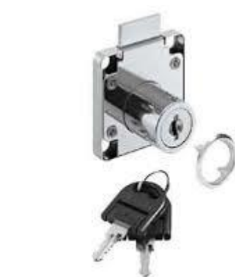
7 Cerradura sobrepuesta