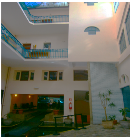
Acceso Telegestiones, muro a demoler y elementos a tapear.