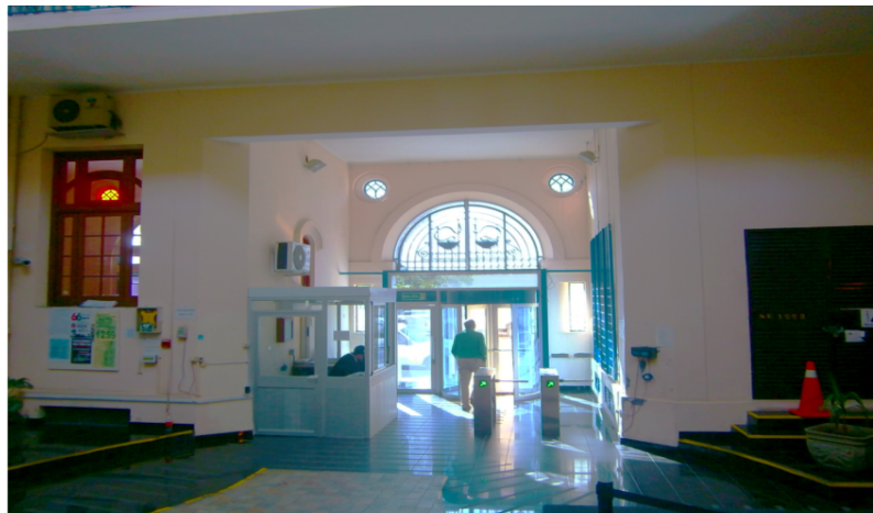
Acceso y garita de control.