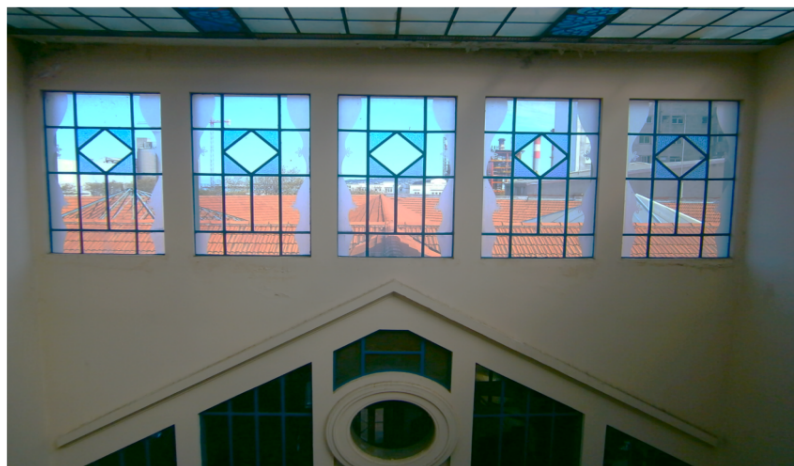
Aberturas de hierro a sustituir.