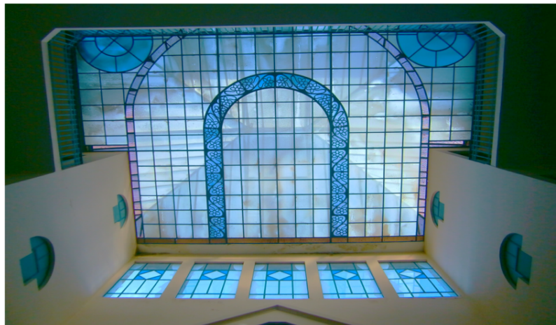
Cielorraso de vidrio a desmontar.