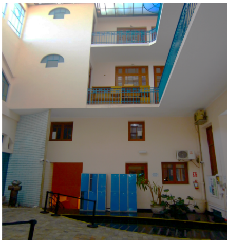
Muro a demoler y elementos a tapear.