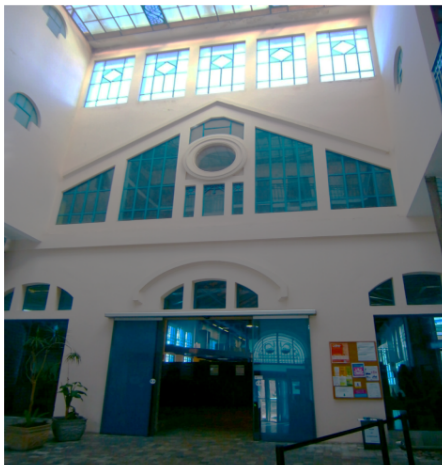
Vidrios fijos y puerta corrediza a tapear.