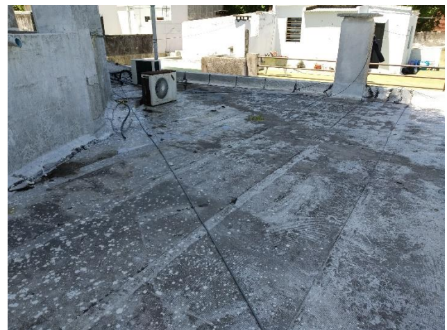
AZOTEA 2 ÁREA 78m 2

1.6 Preparación de la superficie a impermeabilizar. Se retirará carpeta de arena y portland y capa impermeable. Así como los revoques de pretilas que se encuentren flojos o dañados.