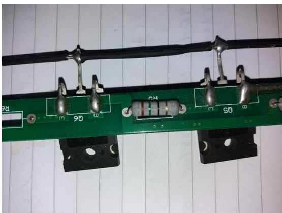
Resistencia de 15 ohms.