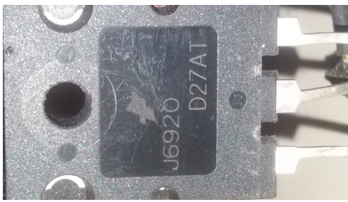
Transistor (triode) J6920.