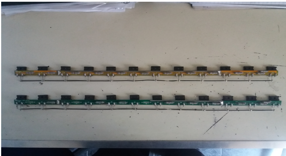
Imagen de plaquetas de circuitos impreso verde y amarilla con componentes.