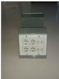
TORRETA de 15 x 30 x 17 cm realizada en chapa decapada #16 pintadas con pintura electro depositada en polvo color gris, para módulos de 6 tomas Schuko y 4 RJ 45 (2 para datos y 2 para teléfono)