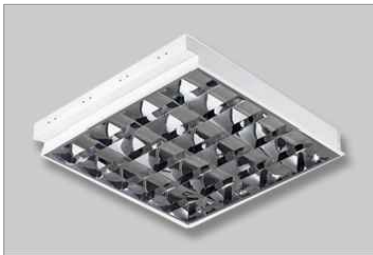
L1 - Luminaria de adosar 60X60 con imperancia electrónica