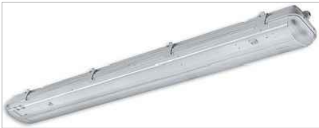
L2 - LUMINARIA SUSPENDIDA, 2 TUBOS CON IMPERANCIA ELECTRÓNICA