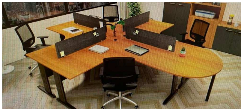
Fotografía meramente ilustrativa.

Todas las ofertas deberán presentar ficha técnica y descripciones gráficas de los productos que se ofrecen, junto a los costos unitarios y el global, y el plazo de garantía de los mismos.