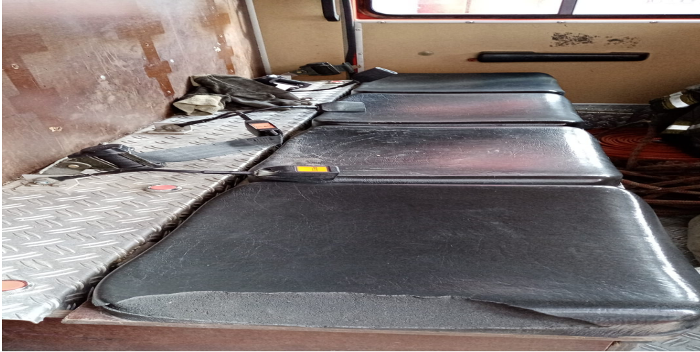
1 – D) Reparación de butaca conductor SMI-2503 MERCEDES BENZ 1117