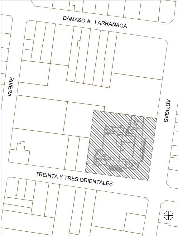
PLANTA UBICACIÓN PALACIO DE OFICINAS PÚBLICAS Esc 1:2000