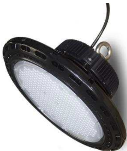
L3- Proyector Led Circular

En el sector del galpón se suministrara y colocará luminarias Led (L3) con un nivel de iluminación de 800 lx.