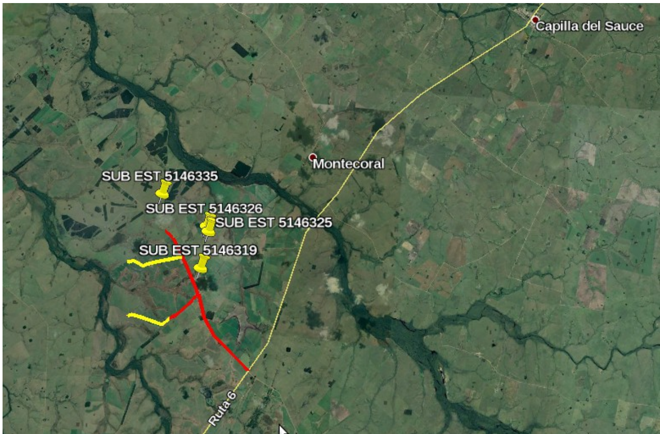
Figura 1. Croquis de ubicación del proyecto.

N° de trámite de UTE (carpetas de consulta): 7120129965, 0083231230, 0621667911