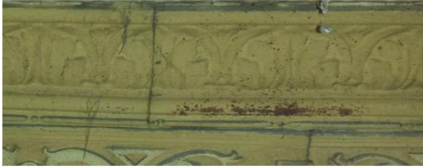
Detalle del tramo intermedio