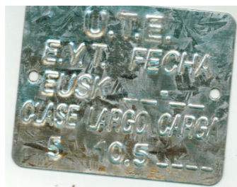
083804 - CHAPA IDENTIFICACION POSTE 10,50m CL5