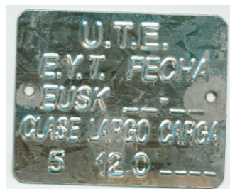
083806 - CHAPA IDENTIFICACION POSTE 12,00m CL5