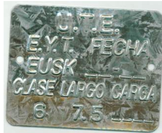
083802 - CHAPA IDENTIFICACION POSTE 7,50m CL6

Chapa galvanizada de 62 mm de largo, 50 mm de ancho y 0,5 mm de espesor, con dos perforaciones laterales y con la leyenda en hueco-relieve según fotos a continuación: