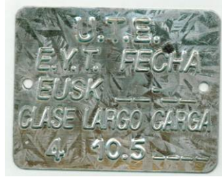
083805 - CHAPA IDENTIFICACION POSTE 10,50m CL4