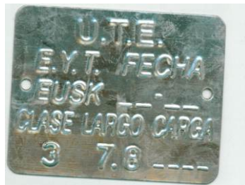
083803 - CHAPA IDENTIFICACION POSTE 7,80m CL3