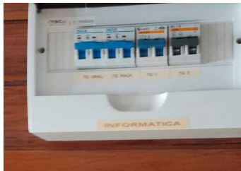
Vista tablero y Rack existentes