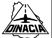
Lámina: N° 01