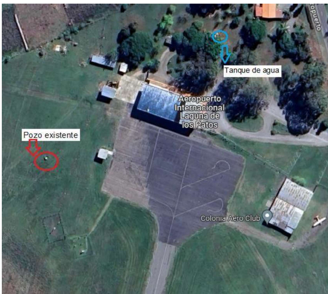
Figura Nr.1 Croquis de Ubicación.