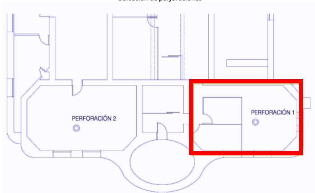
Ubicación de perforaciones

Considerando que se trata de una oficina ubicada en un Edificio Patrimonio Histórico los materiales y componentes a utilizarse deberán responder a criterios de alta durabilidad, resistencia, confort interior y con mantenimiento muy bajo, utilizando productos de primera calidad.