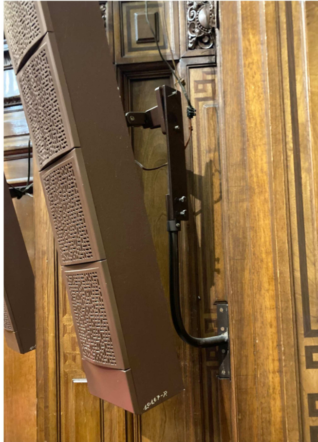
Imagen 2. Soportes de altavoces existentes