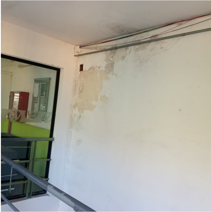
17. Hall Comedor funcionarios (planta alta)