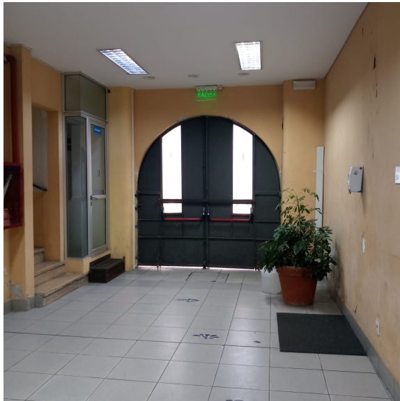
3. 4. Acceso calle Uruguay