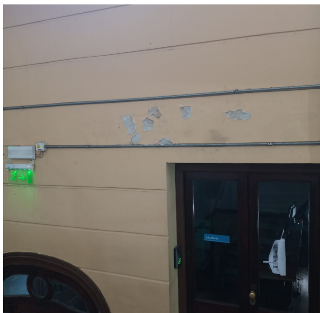
9. Hall Salones C-D