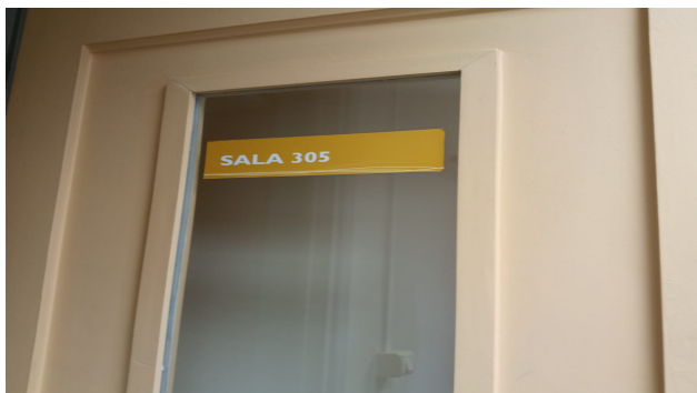
I4.Instituto Educación (Sala 305)