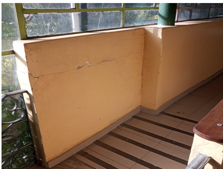
I6. Corredor entrepiso (sector calle Tristán Narvaja)