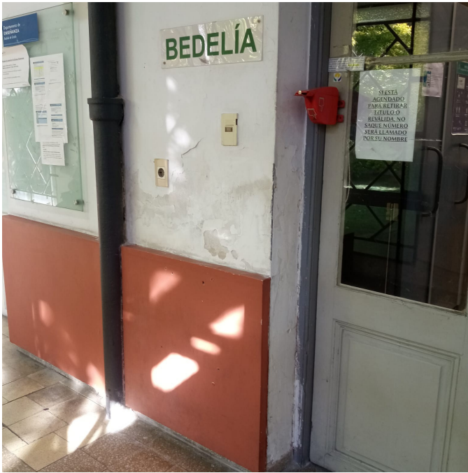
I. Corredor Bedelía (planta baja)