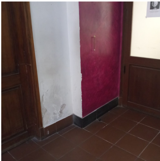
8. Hall Aula Magna