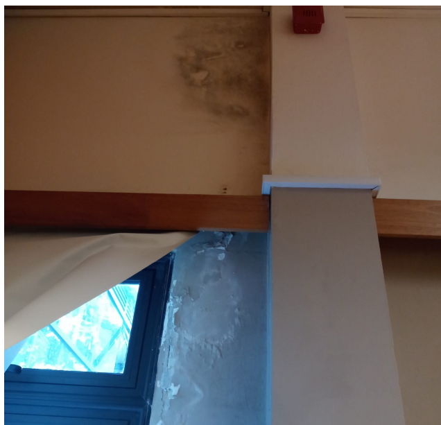
11. Salón de Actos