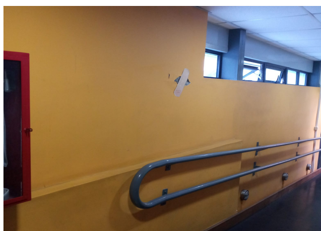
12. Corredor-rampa entrepiso