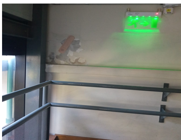
13. Corredor-rampa entrepiso