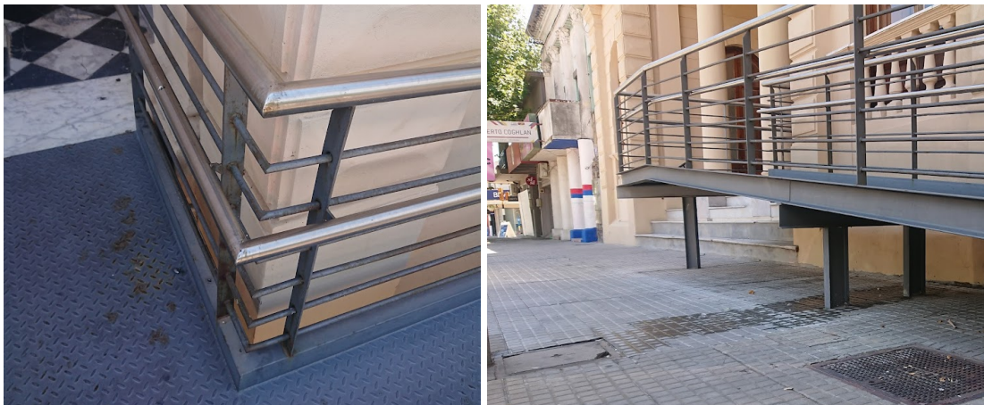
Imágenes de referencia rampa accesible

3.1.2 Cubierta de policarbonato sobre nueva rampa: se deberá desmontar la cubierta existente, en su lugar se construirá una cubierta nueva, de estructura metálica y policarbonato e=1 cm. La cubierta estará comprendida por dos tramos, un tramo correspondiente a la conexión de ambos edificios y un segundo tramo sobre la nueva rampa accesible. La ubicación exacta de la nueva cubierta responde a los gráficos adjuntos (ver plano de rampa y ubicación de pilares metálicos).