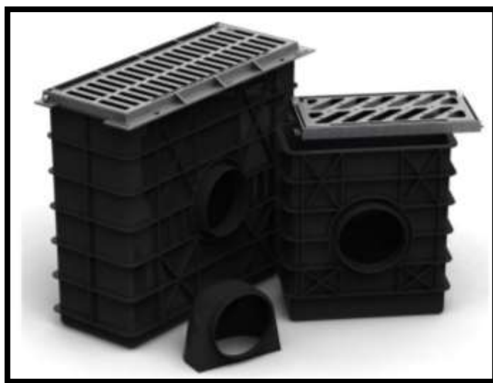
Ilustración 2: Sumidero con rejilla