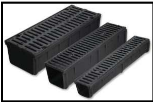
Ilustración 1: Canal de desagüe con rejilla.

A continuación, se muestran imágenes meramente ilustrativas de los productos a suministrar: