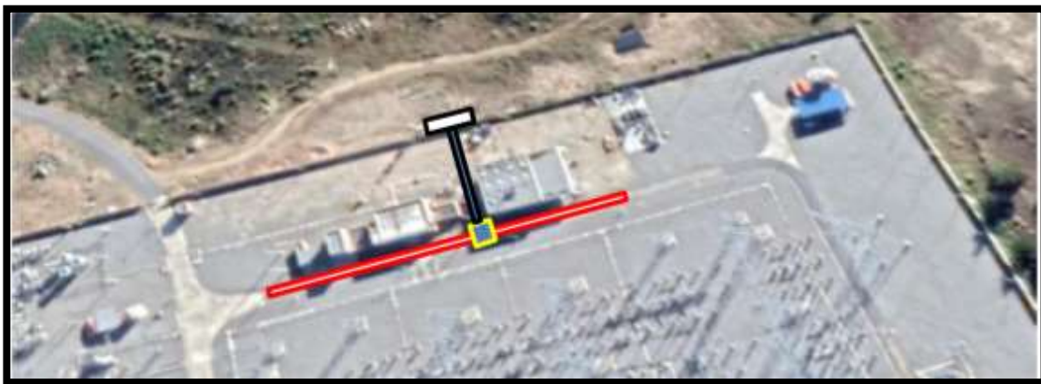
Ilustración 4: trazado del canal completo. En amarillo sumidero, en rojo canales a instalar y en negro caño de PVC.