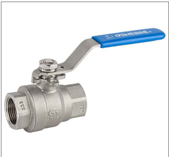
MODELO DE LLAVE DE CORTE A SUMINISTRAR Y COLOCAR