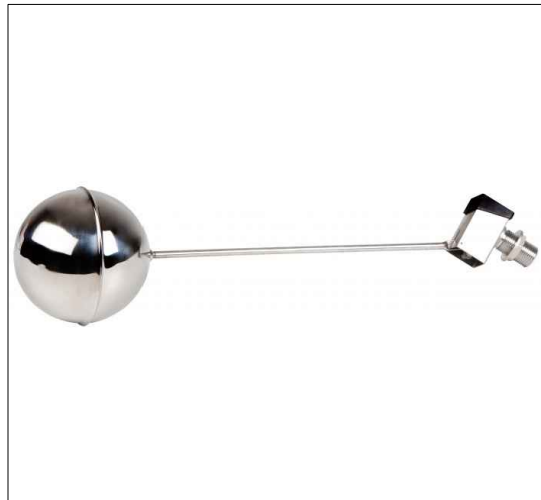
VÁLVULA CON FLOTADOR DE ACERO INOXIDABLE GENEBRE O SIMILAR 1"1/4