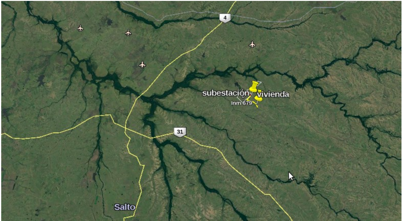
Figura 1 - Ubicación del predio.