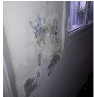
Revoques interiores de tabiques y cielorraso ( zona de aplicación de membrana asfáltica)