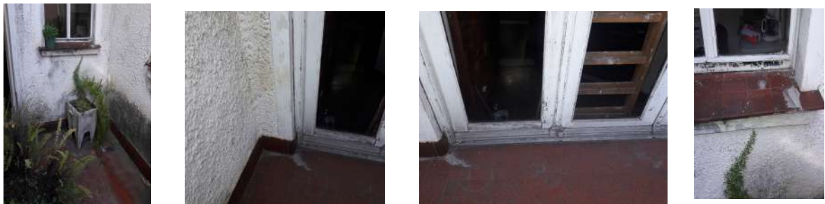
terrazza terminación, antepechos, abertura de carpintería de madera, revoques exteriores