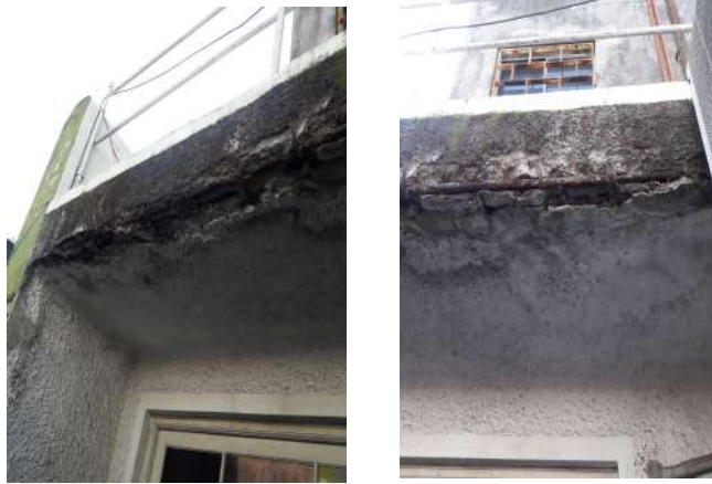
recubrimiento y revoques de losa deteriorado por exfoliación de armaduras