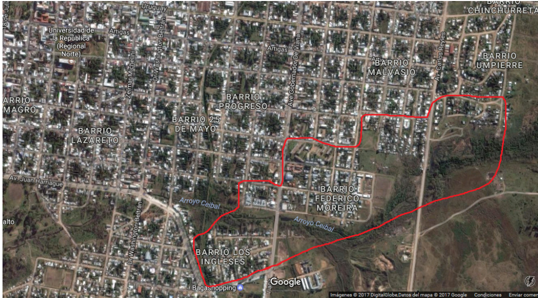
Imagen 2- Zona a intervenir