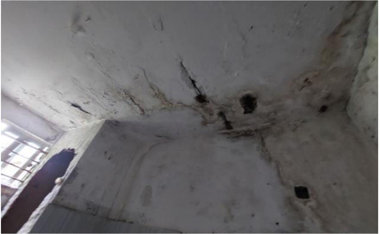
CIELORRASO DEL BAÑO EN MAL ESTADO