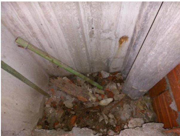
DUCTO, ESTADO AL 01/03/2024