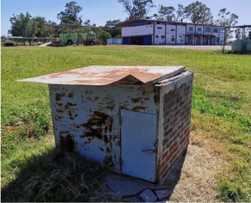
Figura Nr.2 Pozo semi- surgente existente