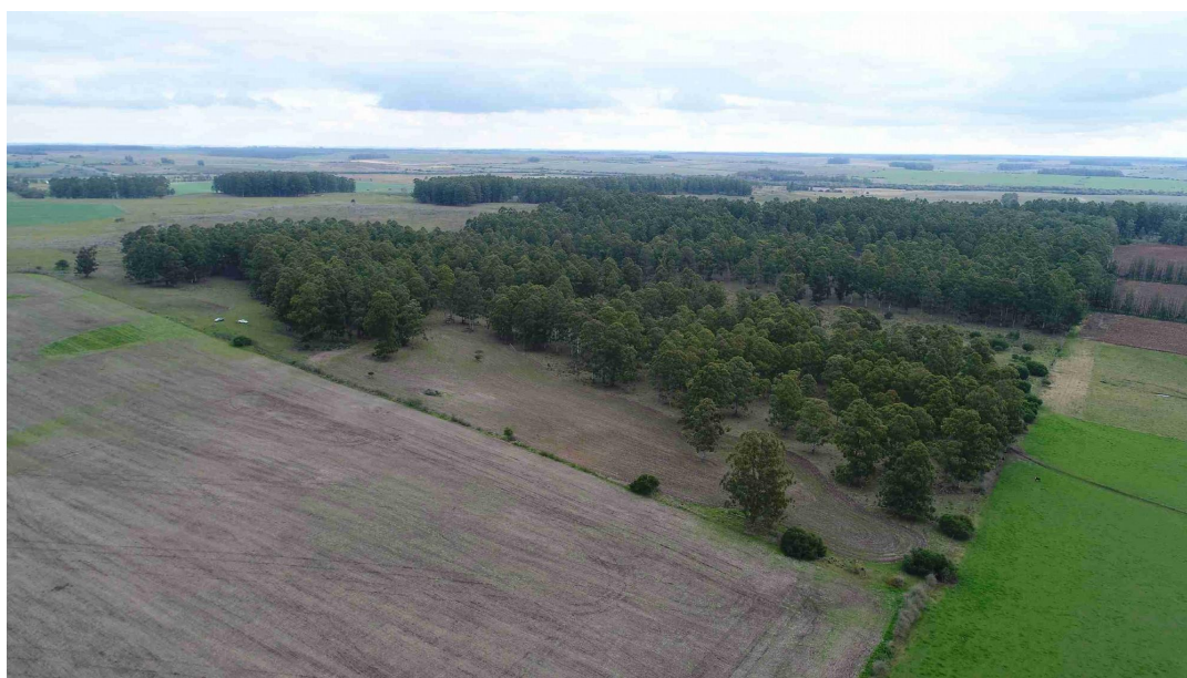
Foto 2. Montes de Eucalyptus desde el sector SE.