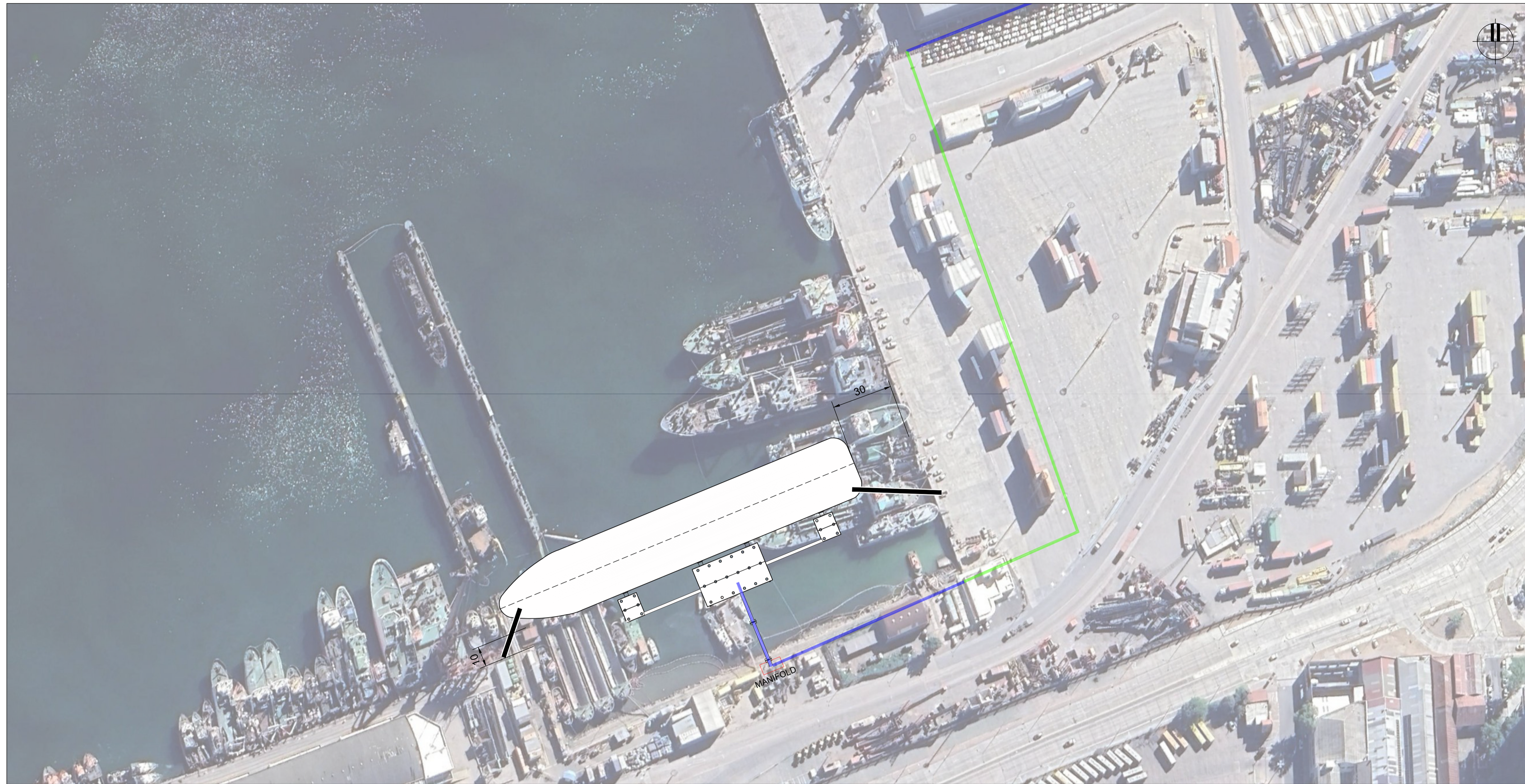
SITIO DE TRANSFERENCIA LAYOUT GENERAL ESCALA 1:1250