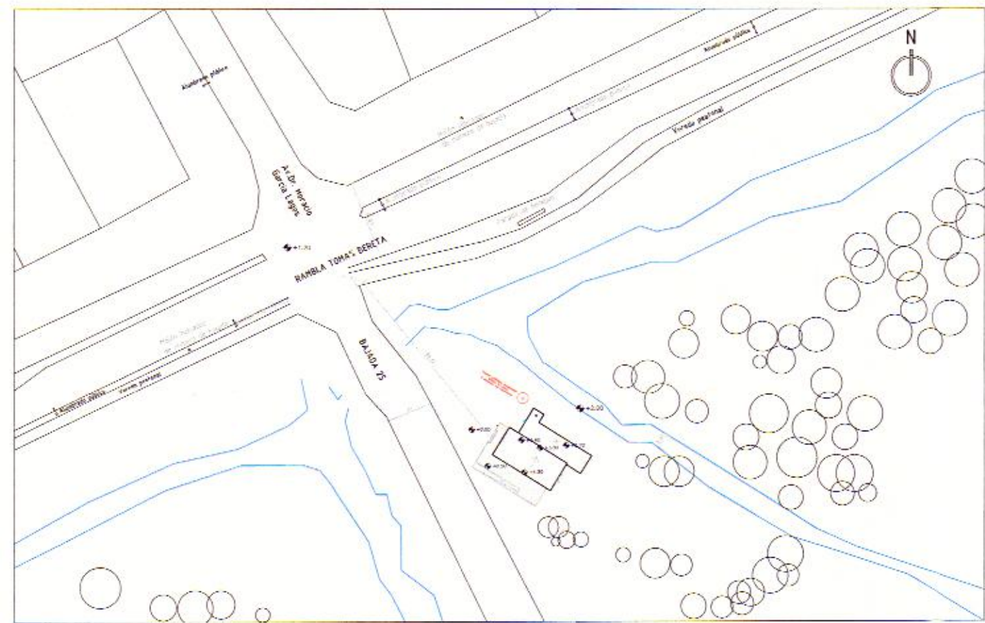
PLANO DE UBICACIÓN 1_1000