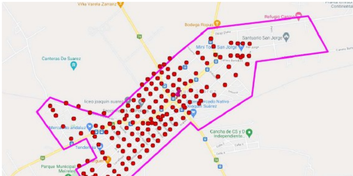
Cuadro N°3: Localización de los contenedores públicos en la ciudad de Toledo