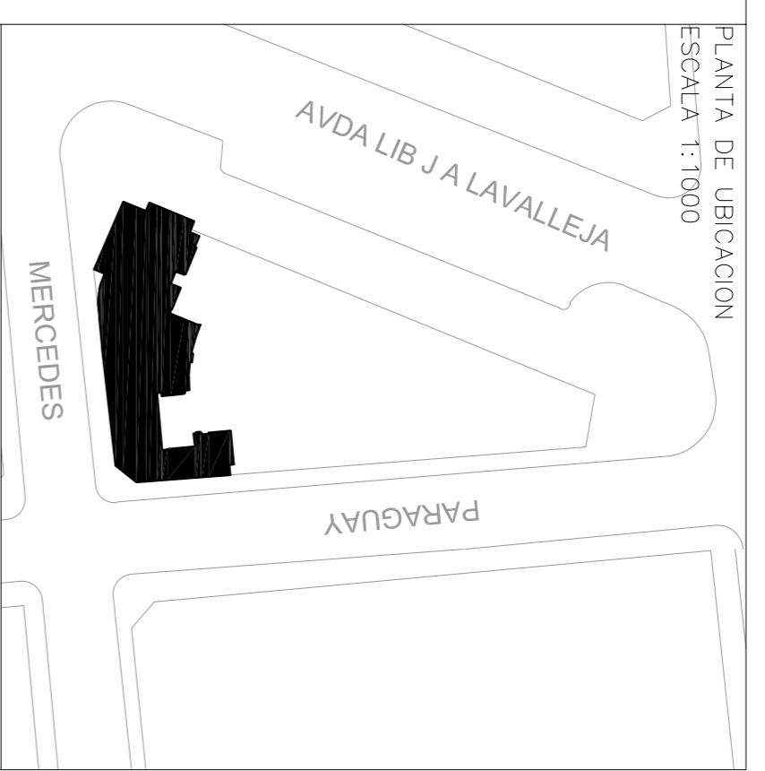
PLANTA DE UBICACION ESCALA 1:1000