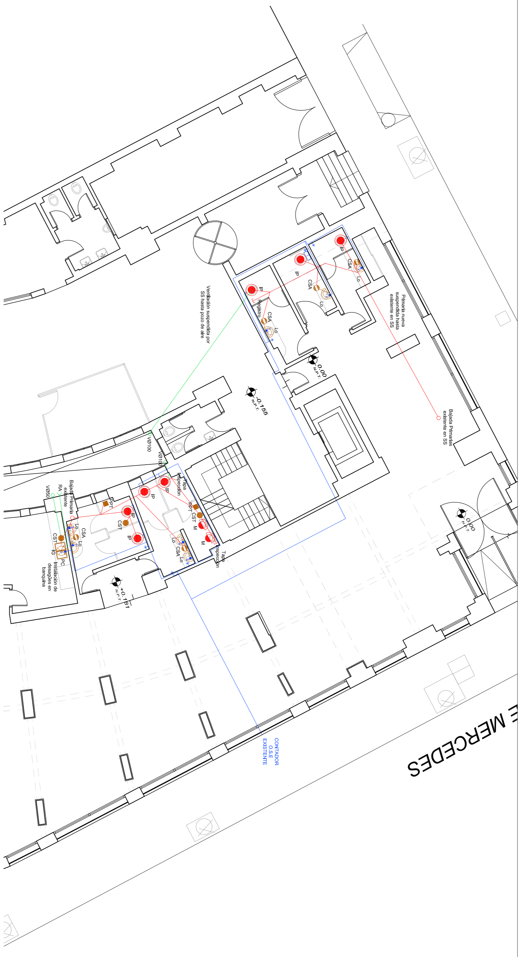
SANITARIA P.B. Esc. 1:100