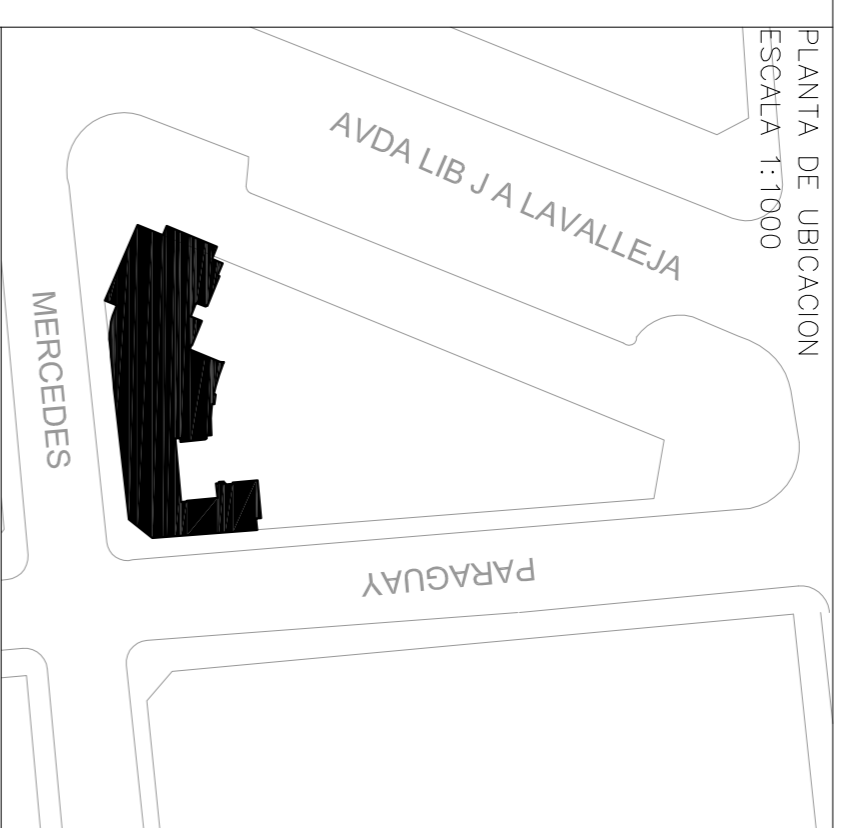
PLANTA DE UBICACION ESCALA 1:1000