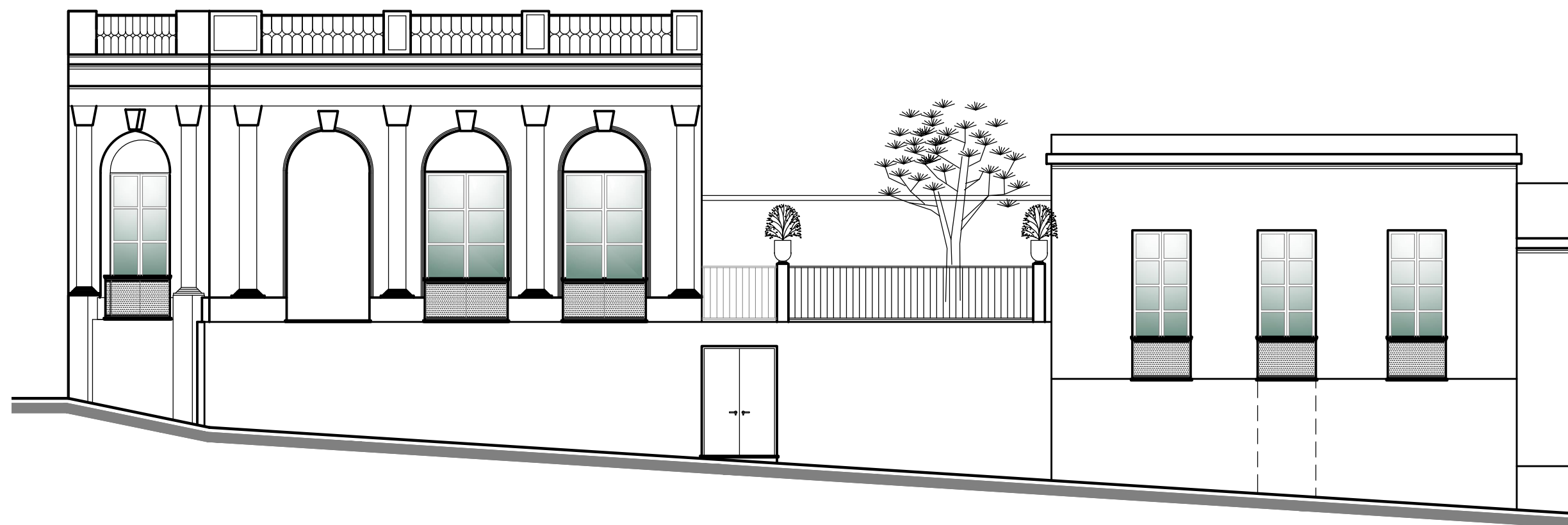
FACHADA CALLE 19 DE ABRIL Escala 1:100