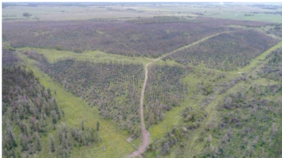
Figura 3: Estado del monte afectado por el incendio. Foto de la fracción 9, obtenida con un dron el 31/09/21 del sector oeste (del rodal que se ubica en el frente de la fracción).