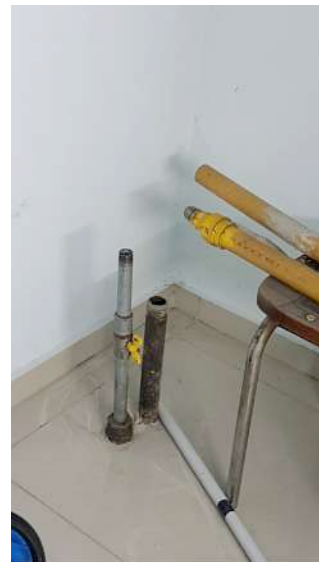
Conexión hacia el exterior