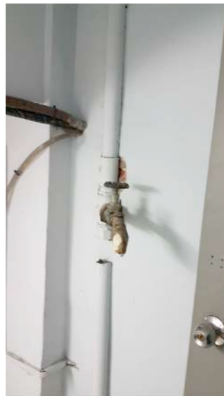
Conexión desde montante