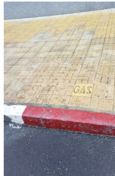
Registro exterior calle Uruguay