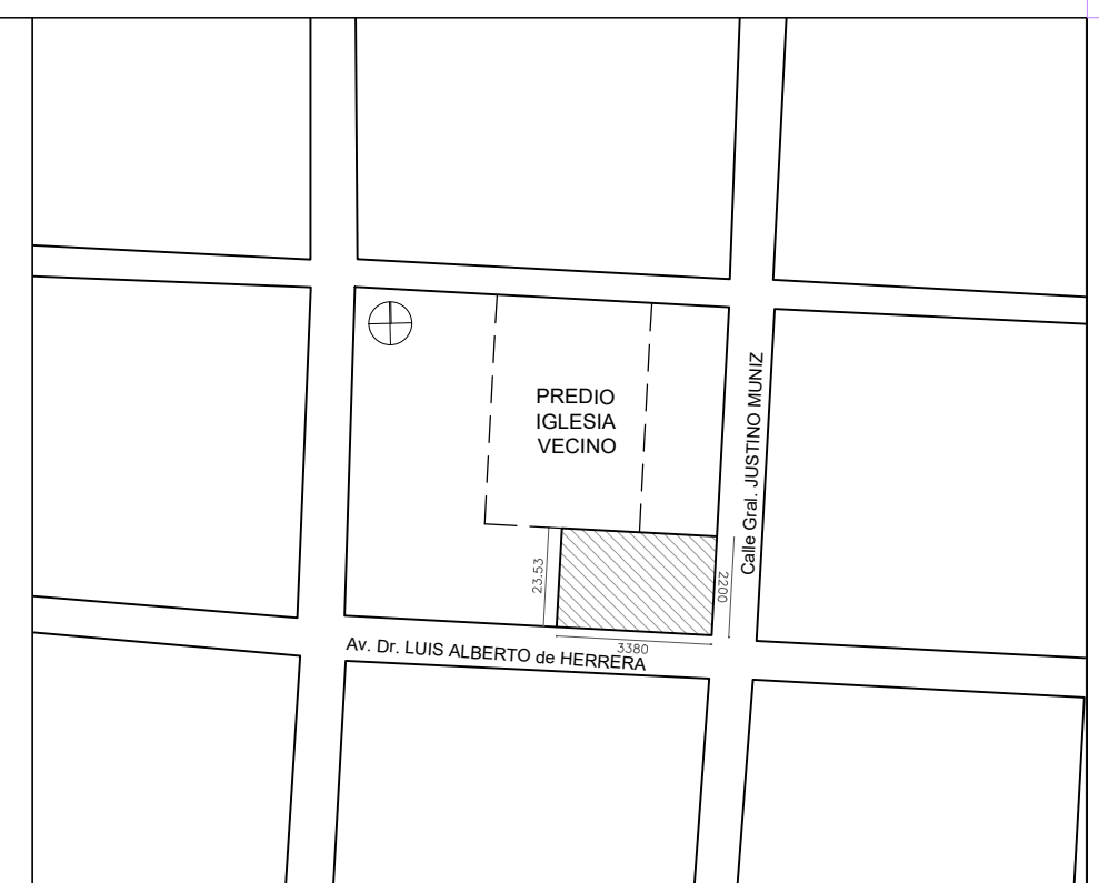
PLANTA UBICACIÓN ESC 1/2000