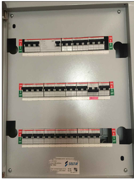
TABLERO "GENERAL" 1