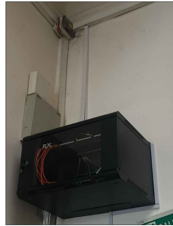
RACK DE DATOS