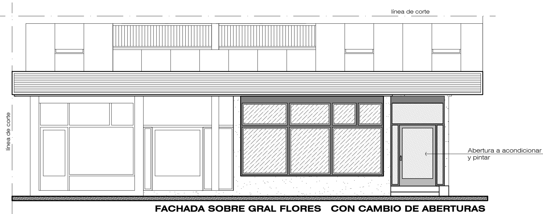
FACHADA SOBRE GRAL FLORES CON CAMBIO DE ABERTURAS