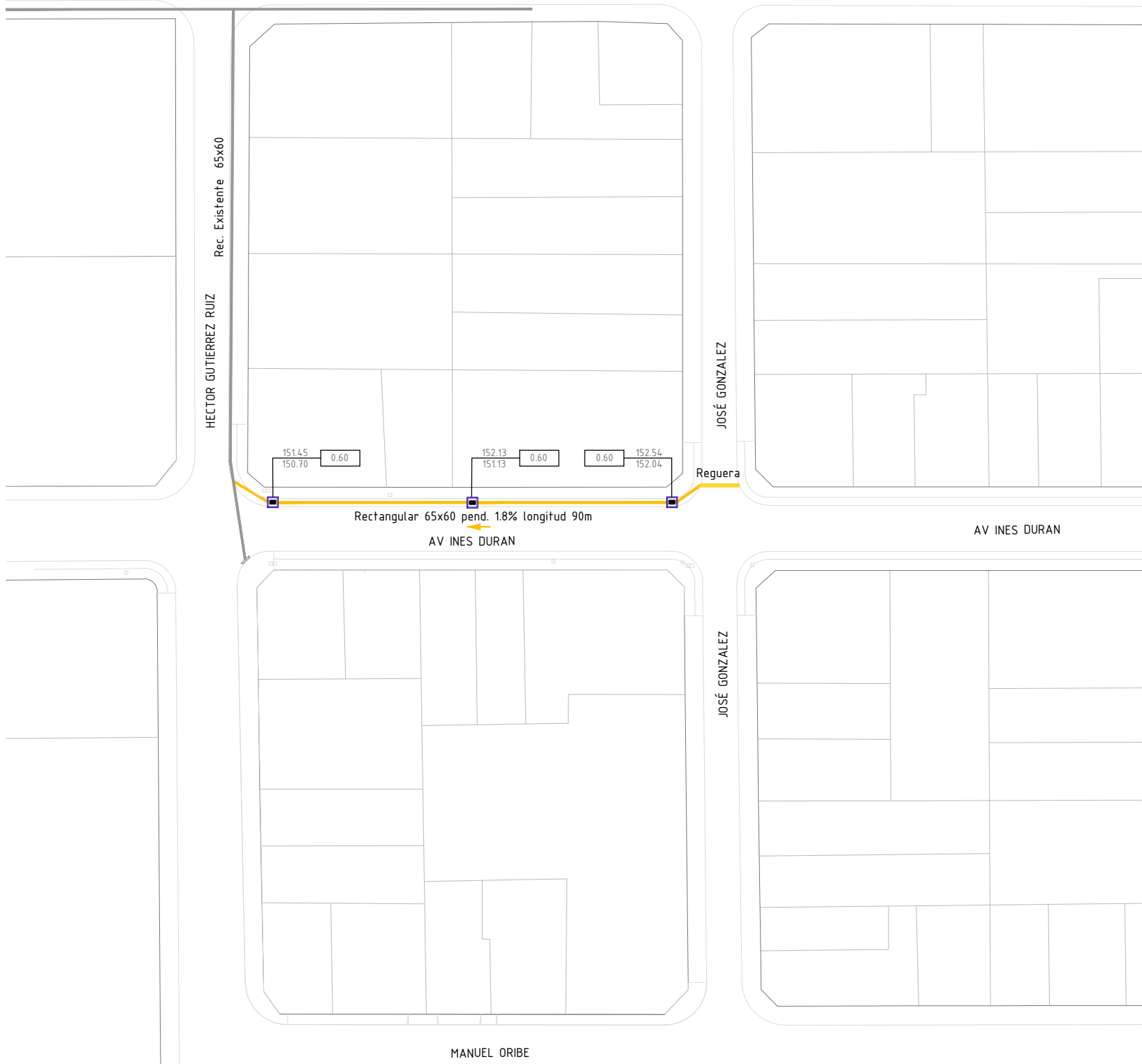
DETALLE INTERVENCIÓN 2 Calles Av. Inés Durán entre José González y H. G. Ruiz Escala 1:1000