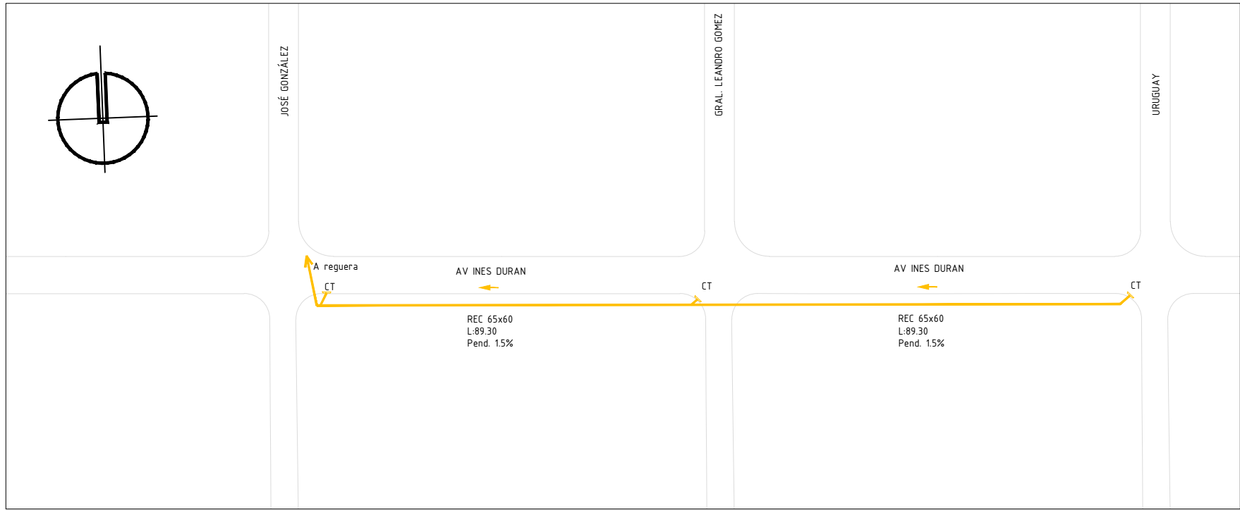
DETALLE INTERVENCIÓN Calle Av. Inés Durán ENTRE José González y Uruguay Escala 1:1250