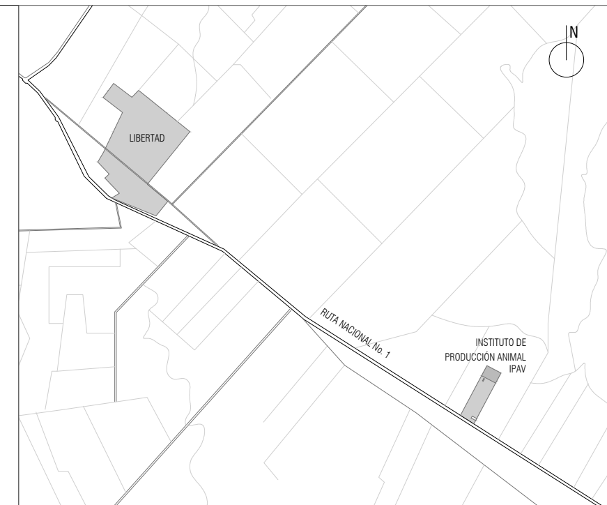
PLANO esc.: 1/100.000