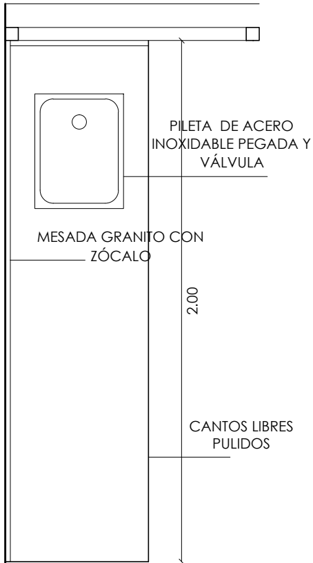
0.55 MESADA 1 ZÓCALO 2.57ML