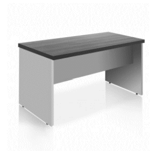
MB4 Escritorio estandar 60x120