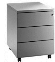
MB1 Cajonera móvil