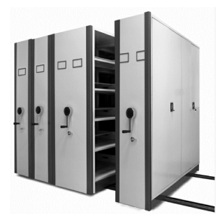
MB5 Esteras móvil