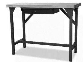
MB2 Mesa de trabajo