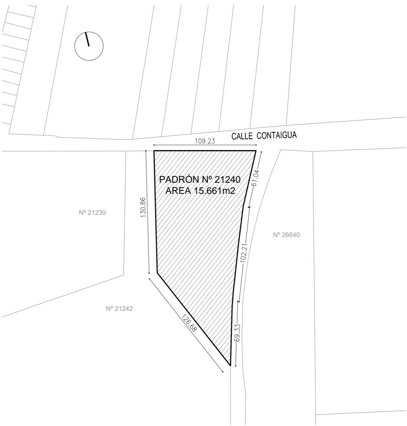
PLANTA UBICACIÓN ESC 1/2500