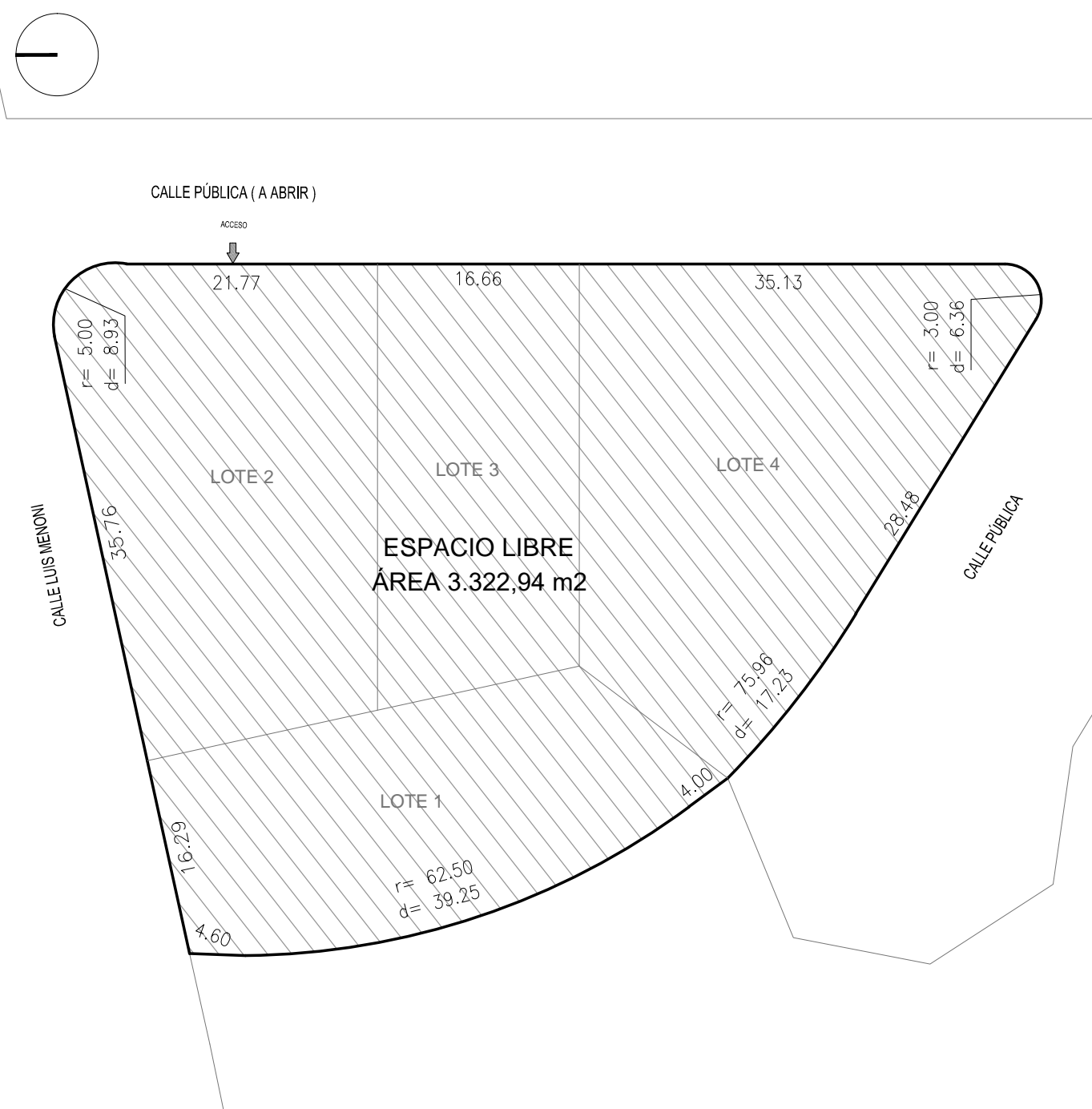
PLANTA UBICACIÓN ESC 1/500