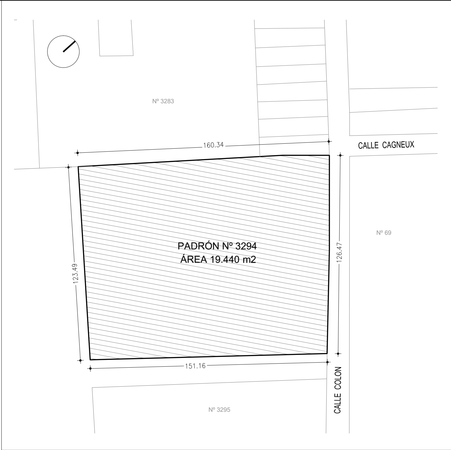
PLANTA UBICACIÓN ESC 1/1500