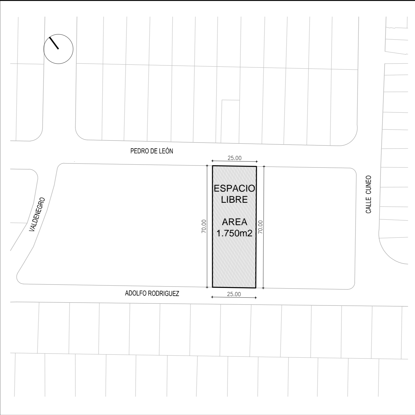
PLANTA UBICACIÓN ESC 1/1250