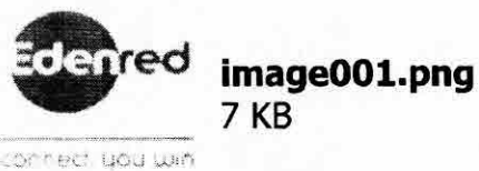
image001.png 7 KB