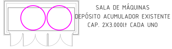
PLANTA - ESC. 1/150