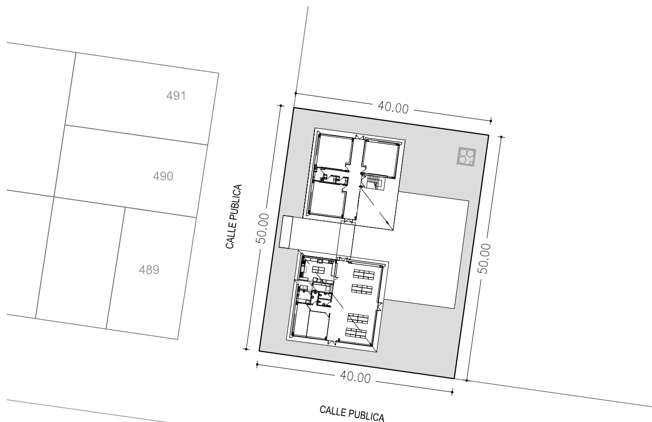
PLANTA IMPLANTACIÓN Esc 1/750