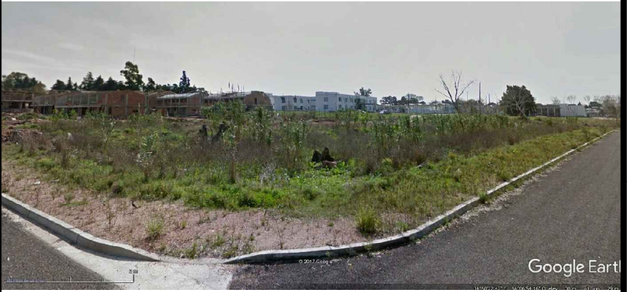
IMAGEN DEL SITIO