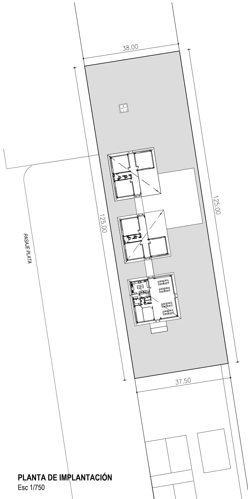
PLANTA DE IMPLANTACIÓN Esc 1/750