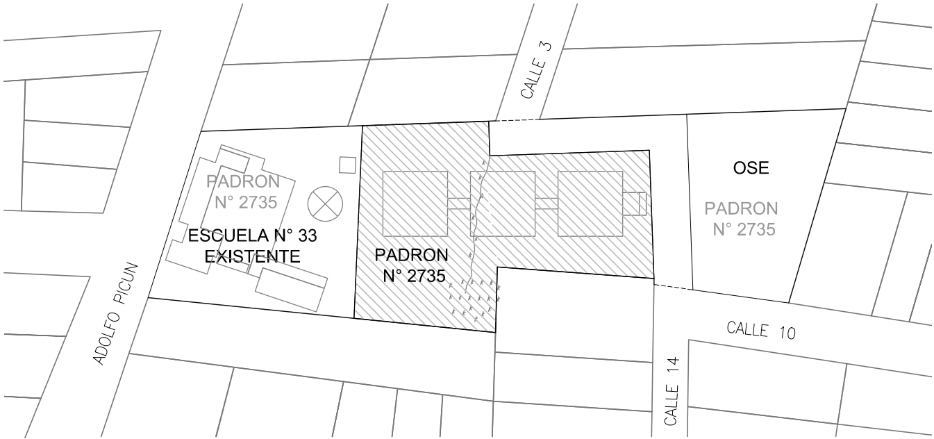
PLANO UBICACIÓN Esc 1/1500