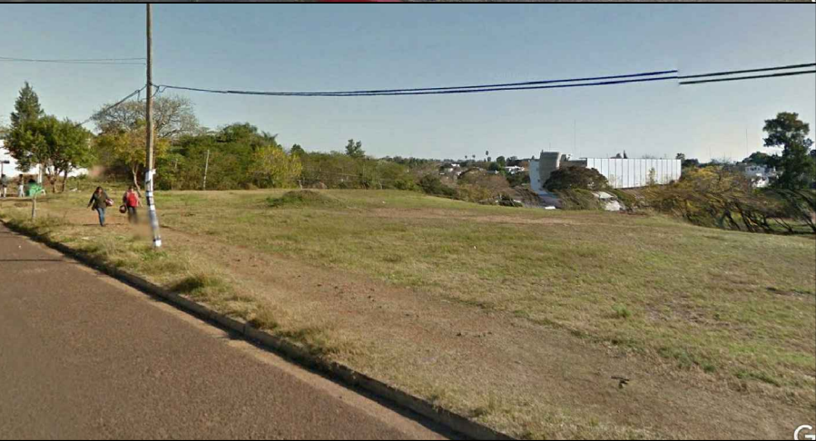
IMAGEN DEL SITIO