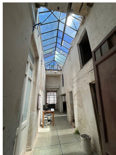
H03 – Administración