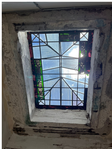
H02 – Espacio Polivalente

Ambas se encuentran graficadas en los cortes correspondientes.