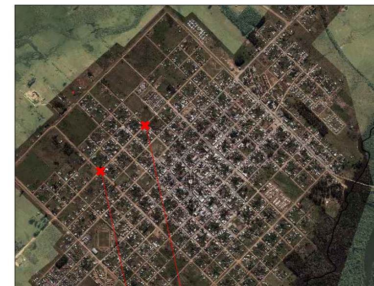
CRUCE B CRUCE A