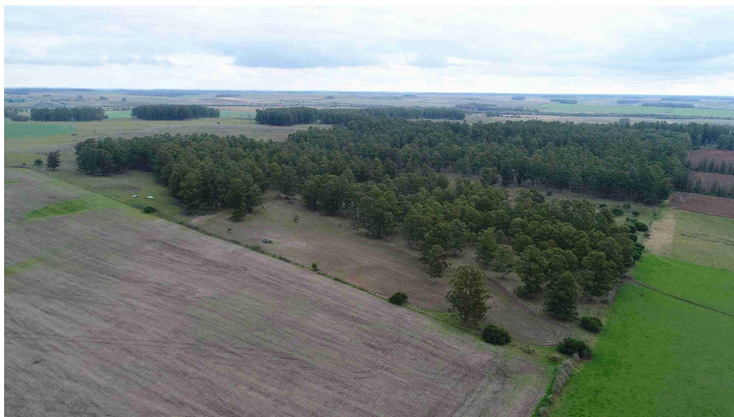
Foto 2. Montes de Eucalyptus desde el sector SE.